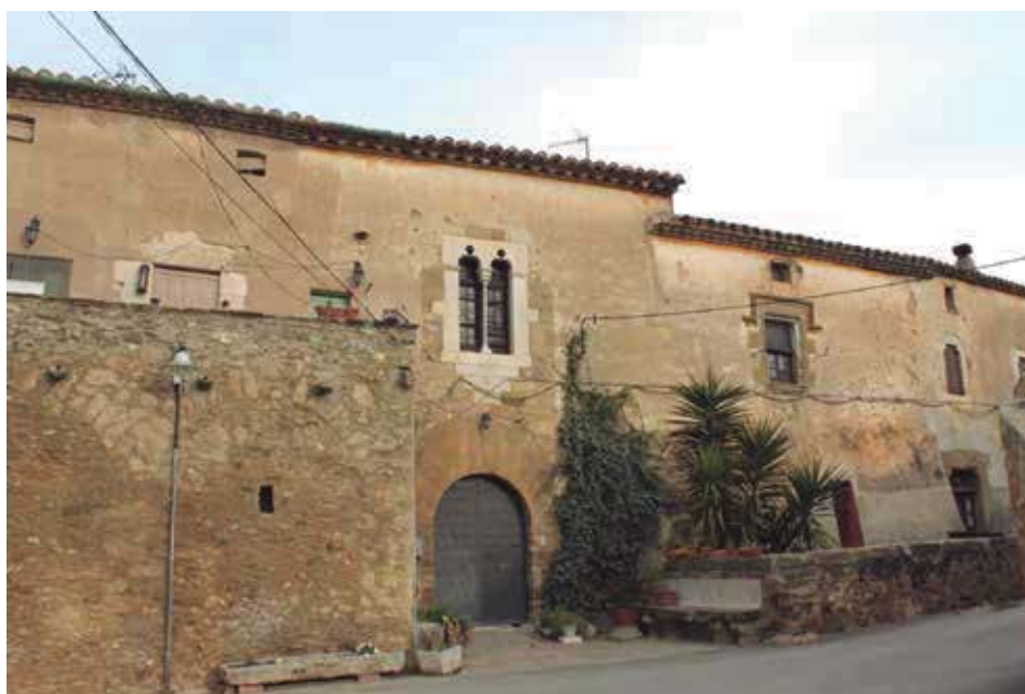
Fig. 7. Fachada de Can Batlle de Llampaies, con los cuatro aleros. A la izquierda, el alero del que no tenemos información; sobre la ventana gótica, el alero de 1802; sobre la ventana renacentista, el alero de 1780; a la derecha, el humilde alero del siglo XVII de una solo orden y el más perjudicado por el hollín. (Fotografía del autor).

La casona fundacional de Can Batlle ofrece la fachada más amplia y magnífica, orientada a Levante, remozada en diversos períodos desde el Gótico al Renacentista, flor de lis incluida en dinteles interiores y exteriores. Tan ostentosa prestancia muestra con idéntico impudor las cicatrices de reformas y toscas ampliaciones que sufrió, y las diversas utilidades que se le dieron a lo largo del tiempo, entre ellas, no menor, la de una sección empleada como horno con una salida de humos que impregnó de hollín parte de los aleros. Coronan los muros de esta fachada cuatro aleros de distinta factura y datación (fig. 7).