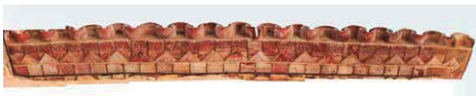
Fig. 6. Vista conjunta del pequeño alero esotérico encontrado en Vilopriu (Girona).

Al pie de ese castillo, en un recodo del entramado de callejuelas, uno se topa con una casa humilde protegida por un alero mínimo lleno de referencias esotéricas (religiosas entre ellas) en una hilada de 28 ladrillos decorados sobre otra de ladrillos en punta de diamante y otra inferior de ladrillos a tizón, estas dos últimas actualmente enjalbegadas (fig. 6).