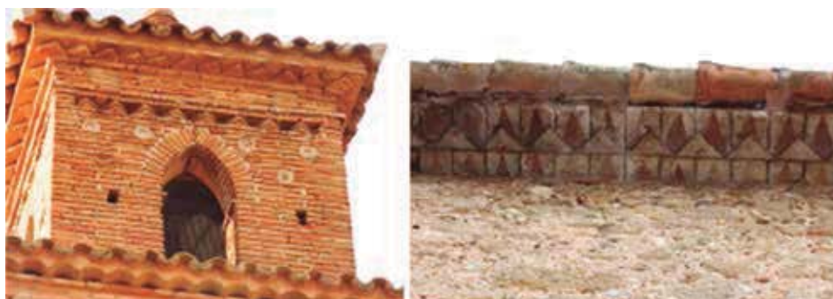
Fig. 3. Herencia mudéjar de los aleros del Terraprim. A la izquierda, alero cerámico de Torralba de Ribota (Zaragoza); a la derecha, alero cerámico decorado de Viladasens (Girona).