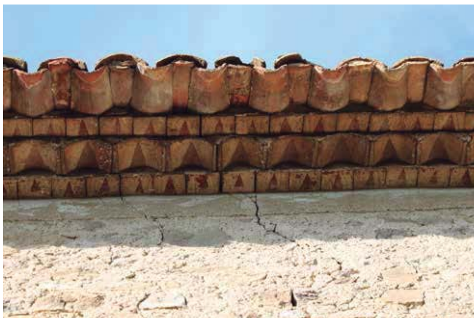
Fig. 2. Alero de Vilafreser (Girona): la cornisa de piezas no encalladas mata la grieta que asciende muro arriba.