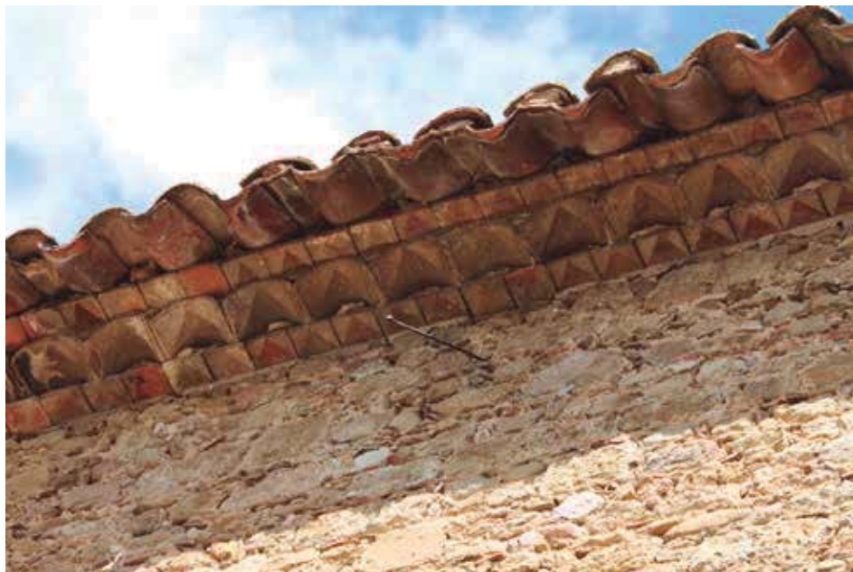
Fig. 1. Alero de tres órdenes en la parroquia de Galliners (Girona).