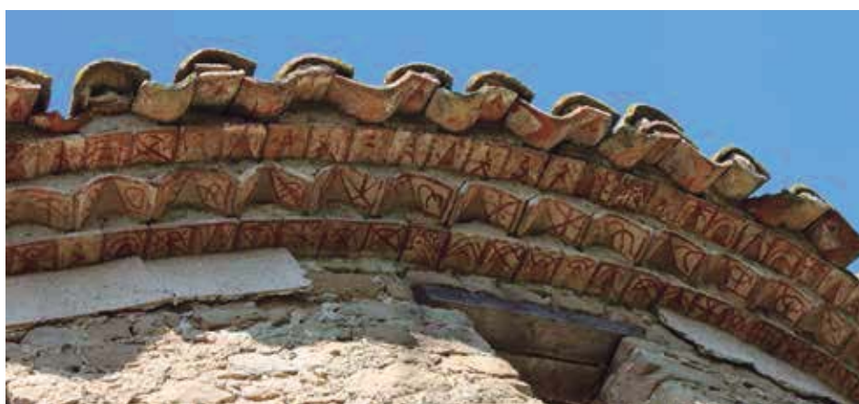
Fig. 4. Ábside de la parroquia de Vilamarí (Girona) pintarrajeado sobre el alero en diente de sierra preexistente. La fecha, en negativo, se encuentra en la primera hilada, ladrillo 10. (Fotografía del autor).

1. La iglesia parroquial de Vilamarí , en el extremo occidental, relativamente cerca de Banyoles. Este conjunto de aleros, originariamente decorados en diente de sierra, tal como se percibe todavía, parece el resultado de un decorador frenético y aparentemente bruto que pintarrajeó lo preexistente estampando trazos sinusoidales y dibujos infantiloides y de ecos freudianos sobre ladrillos, tejas e incluso sobre el mortero de consolidación de las diversas hiladas. El muro de mediodía conserva un fragmento de inscripción que hace referencia a un tal Castro de la vecina villa de