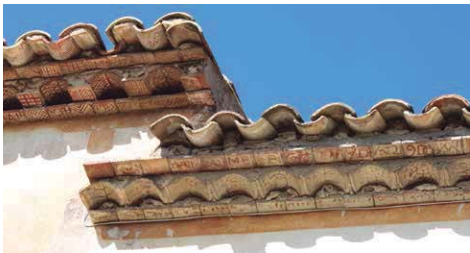
Fig. 8. Detalle del encuentro de los dos aleros principales (siglo XIX a la izquierda; XVIII a la derecha).

En la leyenda familiar de los propietarios actuales de la casa (que no son descendientes de los Batlle) se cuenta que este alero lo fueron pintando los niños a la salida de la escuela, bajo la dirección del maestro. Tiene sentido: un maestro inquieto, culto, heterodoxo iniciado pero discreto, pedagogo nato, bien informado de los acontecimientos. Además, al analizar las piezas una por una, se llega a la certeza de que diversas manos intervinieron en la decoración: una mano experta de trazo seguro y otras distintas y varias inseguras, torpes, zurdas sometidas al dominio de la diestra; compárense por poner un solo ejemplo, en el tercer nivel, los ladrillos 45 (de mano experta) y 20 (de mano torpe).