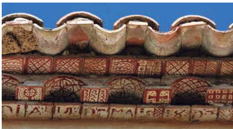
Fig. 9. Detalle de la Zona de bendición sobre la inscripción de fecha y amo (detalle) del alero del siglo XIX. Se puede apreciar el carácter apotropaico de las figuraciones no estrictamente geométricas.